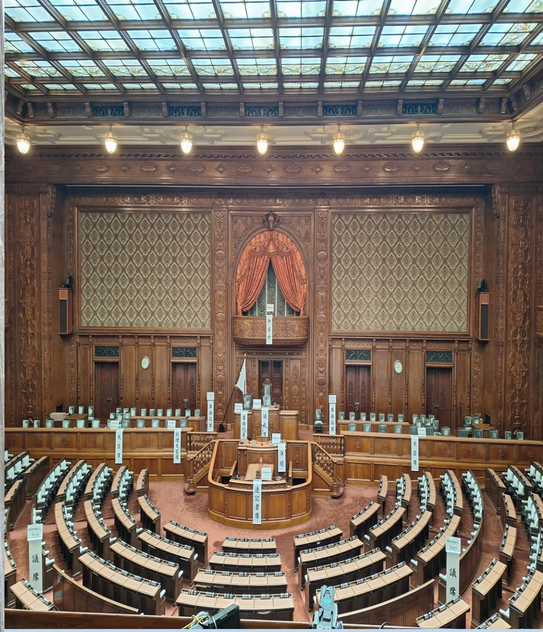
Imperatoriaus rūmų posėdžių salė.