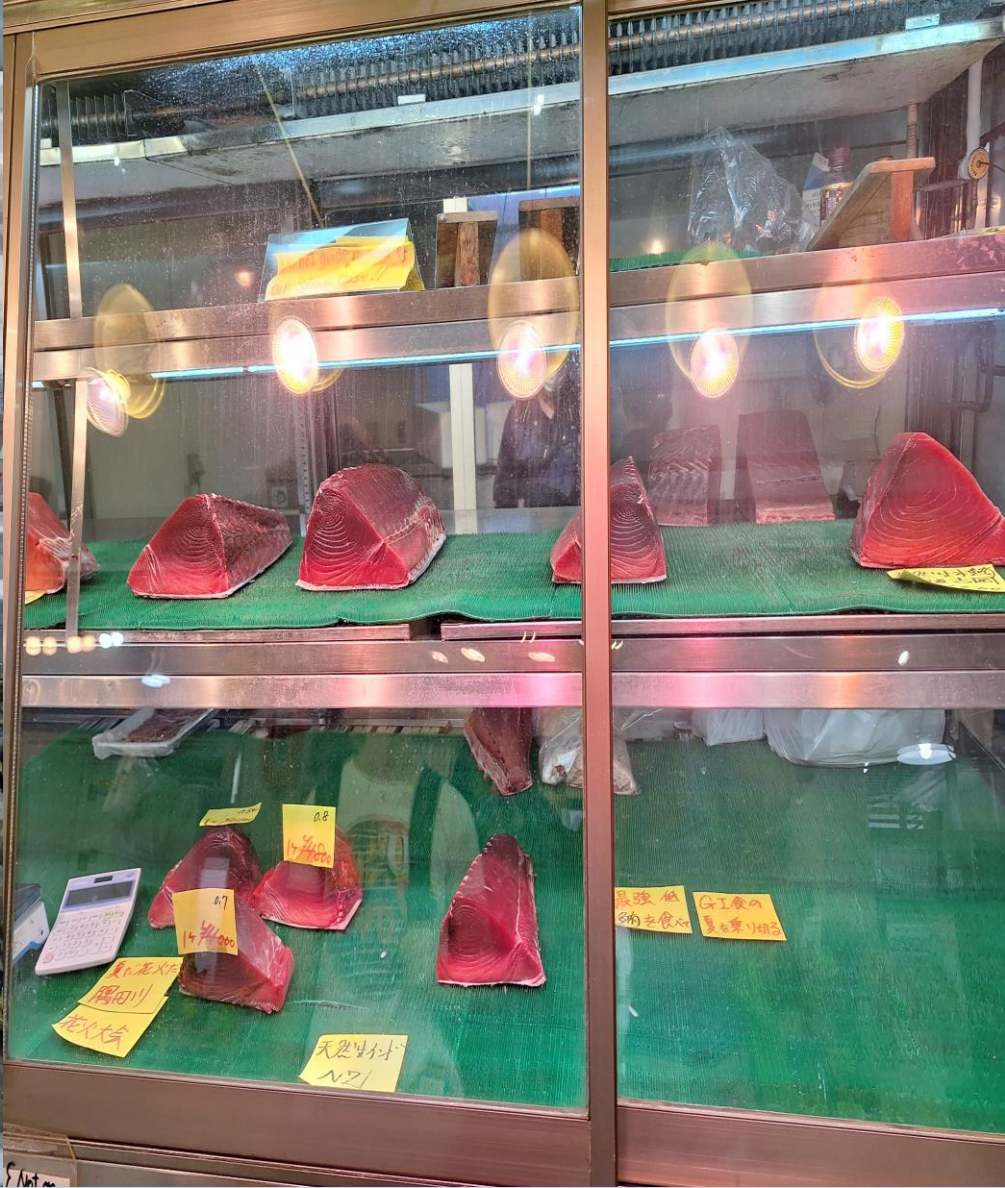
Gigantiškos krevetės ir tunai.