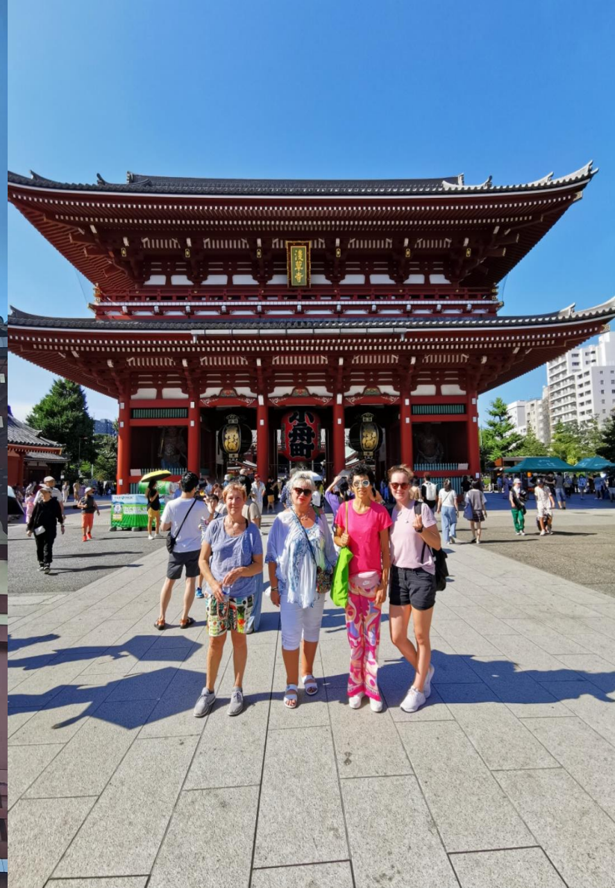
Didžioji Fukuokos šventykla.